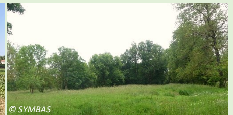
Conversion d'une parcelle cultivée en prairie